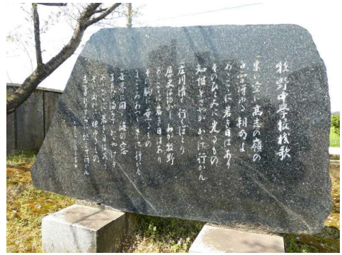
開校40年創校20年記念 (平成2年3月 同窓会寄贈)