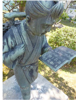
二宮尊徳先生幼時之像 (昭和62年度PTA台座設置)